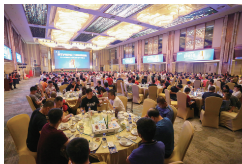
泸州老窖精品头曲核心客户联谊会现场

作为泸州老窖五大战略单品之一，无论是“畅享中国60年，唯时间见证价值”的老头曲，还是“青年商务酒，祝你成功”的精品头曲，亦或是“优选喜酒，一路顺，六六顺”的六年窖，博大营销将士都将团结拼搏，使命必达，为客户创造价值，为泸州老窖重回前三贡献力量！