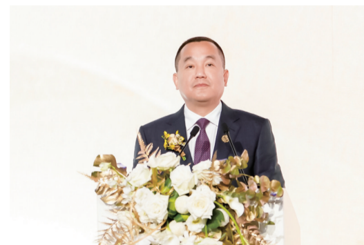
泸州老窖党委书记、董事长刘淼在发布会上致辞