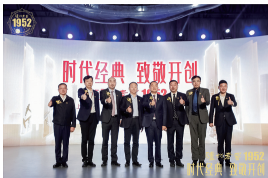
泸州老窖 1952 产品发售仪式现场

“电影《南征北战》还原解放战争场面，智取胜利；土地改革打破封建桎梏，农民翻身成为土地的主人；泸州大曲酒入选‘四大名酒’，获得‘国家名酒’称号……”这是 1952 年，属于中华民族的金色印记，那一年发生的许多事情，都悄然为今天的中国埋下了伏笔。