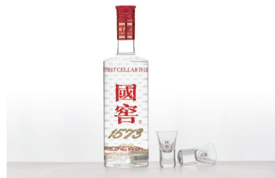
中国超高端白酒的典范——国窖1573

所以,下次再遇到泸州人,你最好还是老老实实地陪他喝酒,至少不用“交学费”。至于酒,主人还管饱。