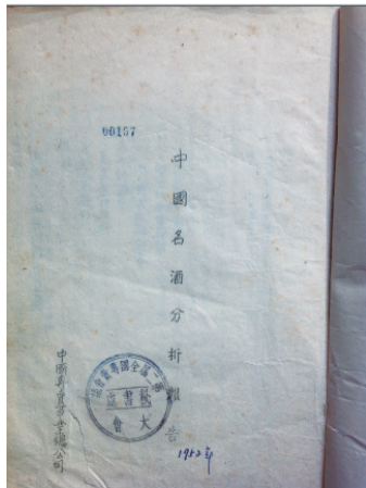
《中国名酒分析报告(1952)》里，明确“四川泸州老窖酒”荣获“中国名酒”称号(第一届)

70年激荡岁月，70载春华秋实。从1952年北京举办第一届全国评酒会至今，中国名酒已走过70年风雨历程。作为唯一蝉联历届“中国名酒”称号的浓香型白酒，泸州老窖承载了一个时代的浓香记忆。自公元1324年，制曲之父郭怀玉发明甘醇曲，酿造第一代泸州大曲酒，历经690余年24代传承人传承至今，七百载的时间沉淀惊艳了岁月，24代的传承淬炼了技艺精华，对中国传统白酒文化、酿造技艺的坚守，勾勒出泸州老窖对中国名酒的拳拳敬畏。“以时代经典浓香，致敬名酒开创者”，泸州老窖将继续弘扬中国名酒之风骨，经典之上再创经典，再铸辉煌！