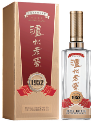
“高端浓香型白酒名酒价值标杆”泸州老窖1952

1952年，埋下了一粒味香醇厚的种子。第一届评酒会引起社会各界的震惊与喜悦。老百姓知道了什么是名酒，名酒在市场的声誉大大提高，销量猛增；在行业中也立起了标杆，树立了榜样，促使各地区的酒业主管部门、生产企业纷纷采取多种形式开展“比学赶超”活动，总结传统操作，开展科学研究，改进生产，提高产品质量，促使酒业步入了大规模发展轨道。