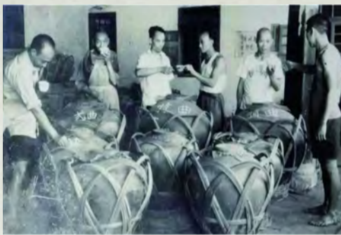
20世纪50年代,泸州老窖按照质量等级将泸州大曲酒划分为“特曲、头曲、二曲、三曲”,按质分级、按质定价

1961年,我初到重庆市糖酒公司计划统计物价科参加工作,当时挂了三块招牌,除市公司的一块外,还有“四川省糖酒公司重庆调拨转运站”和“重庆市酒类专卖事业管理局”的两块。我所在办公室陈列柜内,凡是进入重庆市场的酒品都在展示之列,包括泸州老窖特曲、头曲、二曲和三曲。