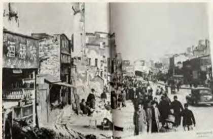
1941年4月10日,重庆热闹的街景

重庆市在全中国乃至全世界的地位相当特殊和重要,而泸州市自古有“小重庆”之称。作为中国浓香型白酒起源地,泸州与重庆密切相连。早在抗战爆发之前,泸州人便在重庆市场开拓布局设点大量宣传,精选闹市中心和码头车站开设自家分号分店,利用报纸杂志刊登广告,“真正泸州大曲”“绝非一般代销经销可比”“真正名贵礼品”等用语深入人心。